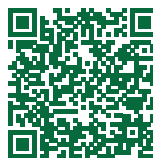
Infoblatt als PDF zum Download Bewegung, Medien- nutzung, Schlaf